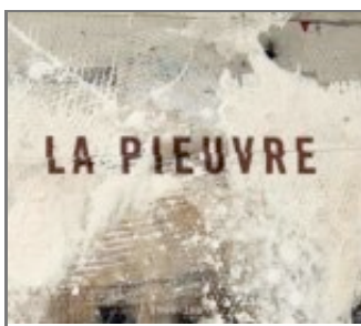
La Pieuvre - "1999-2005" Circum-disc - 2006