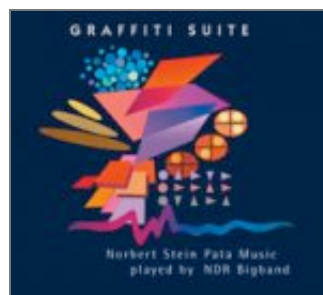
Norbert Stein / NDR Big Band - "Graffiti Suite" Pata Music - 2006

► Graffiti Suite laisse transparaître la rigueur très germanique de son leader : un premier disque est consacré à des compositions ouvertes, aux structures basées sur des associations de timbres savamment pensées jouant plus sur les combinaisons d'éléments de l'orchestre que sur l'effet de masse ( Musik in 7 Häusern ). Le second disque présente, lui, une approche plus orchestrale, réintroduisant des structures rythmiques plus conventionnelles. Ainsi, Der Berg s'ouvre sur une base confiée à un quartet batterie/basse/piano/guitare sur lesquels viennent se poser les clusters de l'orchestre. Fegefeuer des Vokale nous emmène vers des rivages qui fleurent bon la Great Black Music ... Made in Germany ! (à noter : la présence de Christof Lauer, toujours très pertinent au sax ténor). Norbert Stein sait aussi tirer profit de la masse de l'orchestre non seulement sur le plan instrumental mais aussi vocal avec une utilisation intéressante des voix parlées ou utilisées pour créer des nappes flottantes. En résumé : Graffiti suite est un disque à deux faces, deux visages en deux disques, l'une plus nettement référée au jazz (voire à Zappa pour Maschinenmansen , l'autre plus ouverte, plus aventureuse (mais sous contrôle du leader !).